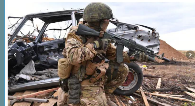
En rysk soldat från Wagnergruppen nära Bachmut i Ukraina. Bilden är publicerad av ryska statskon...

PREMIUM Flera våldsamma filmklipp kopplade till den ryska milisen Wagnergruppen ses av miljontals på Tiktok.